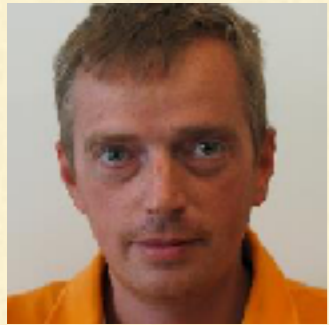
Claudio Arezzo Differential Geometry and Geometric Analysis