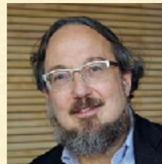
Don Zagier (Ramanujan Intl. Chair) Number Theory