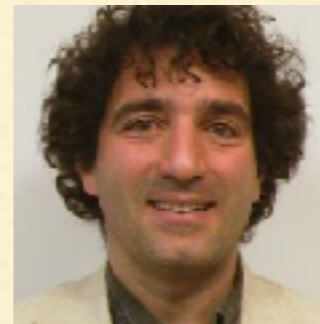
Stefano Luzzatto Dynamical Systems