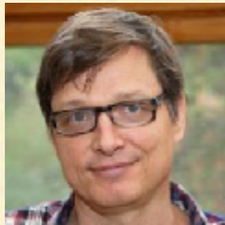
Lothar Gottsche Algebraic Geometry