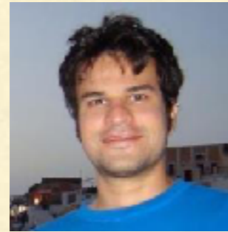
Emanuel Carneiro Harmonic Analysis and Number Theory